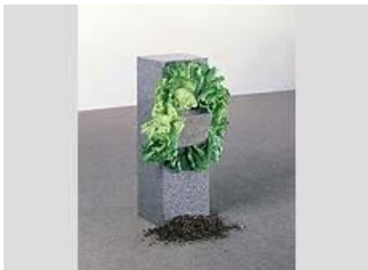
Senzo titolo de Giovanni Anselmo

Les artistes donnent une place fondamentale aux processus évolutifs des matières et des matériaux utilisés (par exemple, sel, café, plantes, animaux, pierres, fruits, cire, acides, charbon, bois, coton, gaz) et l'accent est souvent mis sur les caractéristiques éphémères et périssables des matériaux qui peuvent constituer l'œuvre en partie ou en totalité.