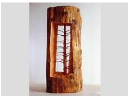
Cedro di Versailles de Giuseppe Penone