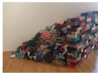
Le Mur de Chiffon de Pistoletto