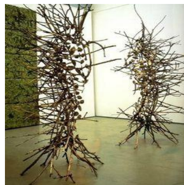
Peau de feuille de Giuseppe Penone